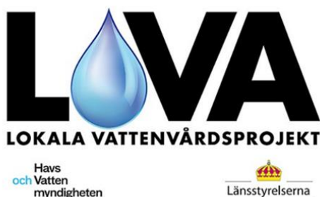
Figur 2. Foto på algblomning i sjön Alstern under sommaren 2014 och loggan för LOVA, lokala vattenvårdsprojekt.